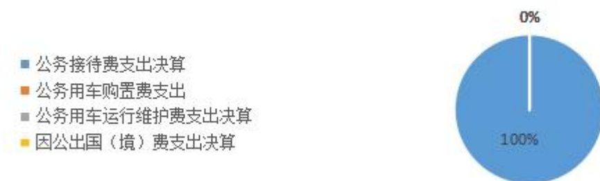
2020年“三公”经费财政拨款支出决算占比图

2020年“三公”经费财政拨款支出决算中，因公出国（境）费支出决算0万元，占0%；公务用车购置费支出0万元，占0%；公务用车运行维护费支出决算0万元，占0%；公务接待费支出决算7.62万元，占100%。