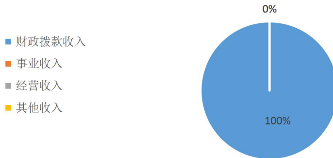
2020年收入决算情况占比图

2020 年收入合计 361.55 万元，其中：财政拨款收入 361.55 万元，占 100%；事业收入 0 万元，占 0%；经营收入 0 万元，占 0%；其他收入 0 万元，占 0%。